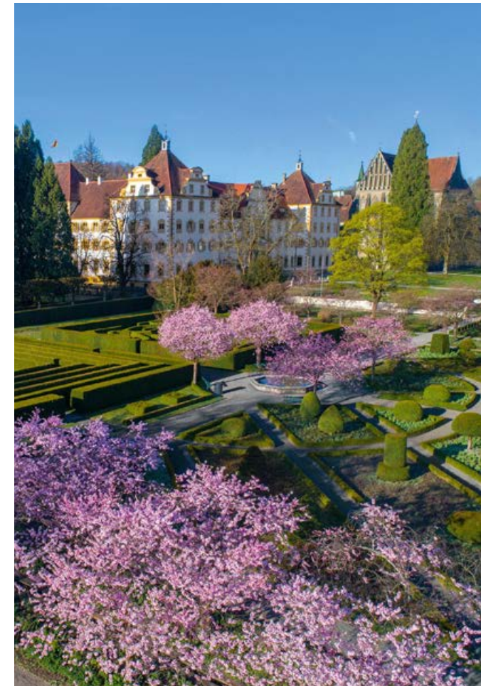
Kloster und Schloss Salem

Für Gruppen ab 10 Personen, 3 Tages-Tour, organisiert von art cities Reisen Konstanz. www.art-cities-reisen.de