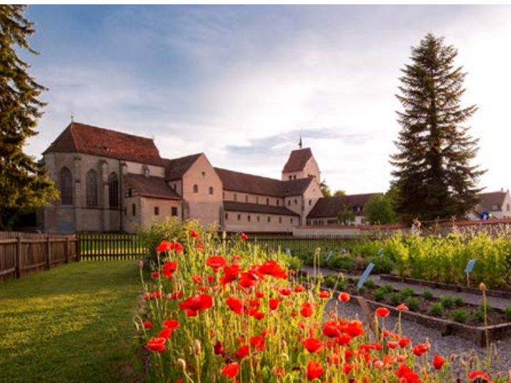
Kräutergarten auf der Insel Reichenau

Ausgehend vom Klosterplan in St.Gallen führt die Klostersgartentour über die Kartause Ittingen und die Klosterinsel Reichenau bis zu den barocken Klöstern mit ihren Gärten in Oberschwaben. Der Besuch der Klostergärten wird zu einer abwechslungsreichen Zeitreise durch die Geschichte der Gartenbaukultur in der Bodenseeregion.